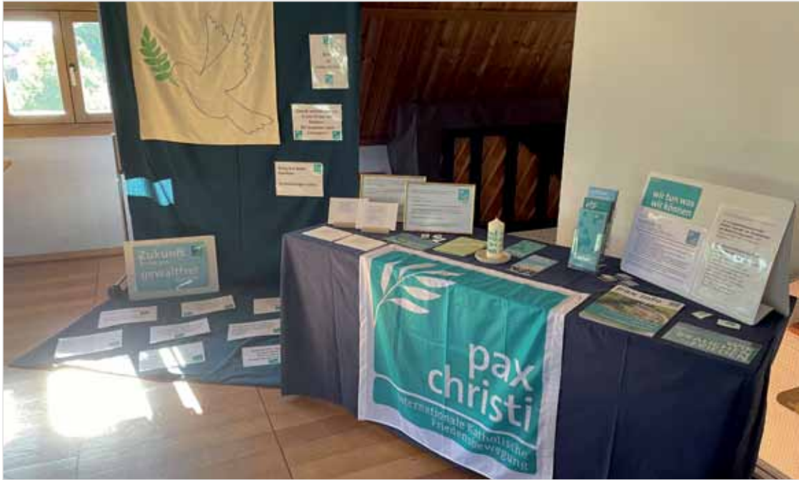
Friedenstisch von Verena Nerz, beispielhaft im Rahmen der Diözesanversammlung arrangiert.

zu. Da die Grenze nach Georgien und Armenien offen ist, sind bereits Zehntausende Russen ins Land geflüchtet, darunter auch viele Oppositionelle, was zu weiteren Spannungen in der georgischen Bevölkerung führt mit Blick auf die Arbeits- und Wohnsituation. Menzel betont in seinem Vortrag auch das große Engagement von act for transformation im Rahmen der Unterstützung von Deserteuren und Kriegsdienstverweigerern aus Russland, Belarus und der Ukraine, die u.a. über Georgien flüchten – eine Kampagne, die auch von pax christi Rottenburg-Stuttgart unterstützt wird. Während des Austauschs mit Menzel wird klar: die Anwesenden plädieren für eine massive Erhöhung der Ressourcen für den zivilen Friedensdienst, um die Zivilgesellschaft zu stärken und damit das wichtigste Potenzial für eine zivile, gewaltfreie Bearbeitung von Konflikten zu entwickeln.