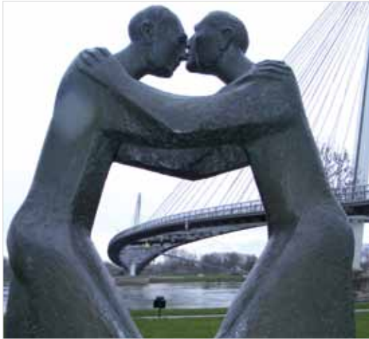
Bronzeplastik „Begegnung“ des Münchner Bildhauers Josef Fromm (1994) nahe der 387 Meter langen „Brücke der zwei Ufer“ (2004) – ein inspirierendes friedenspolitisches Symbol, auch für die Tagung

einen neuen breiten und anerkannten Sockel gestellt werden.