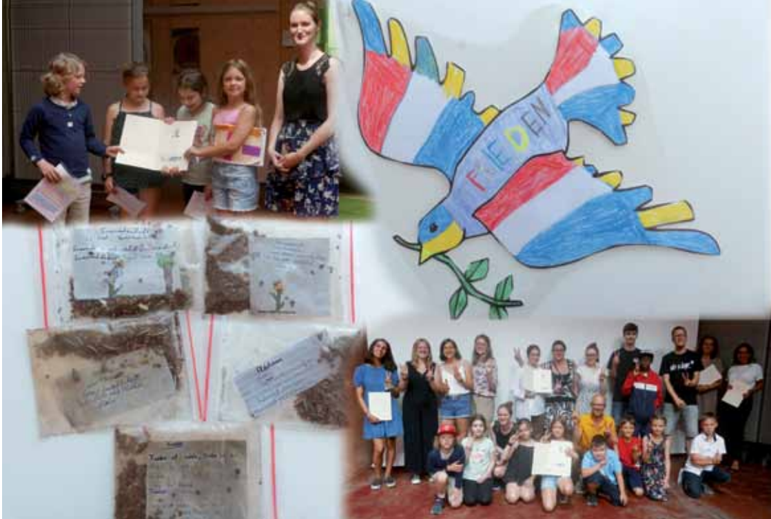
Oben links: Lerngruppe 3b der Spitalhof-Gemeinschaftsschule Ulm, die Träger:innen des 2. Preises; ihr Beitrag heißt „Nicht ... „nur geträumt“ – Frieden schaffen und leben mit Worten – Gedichte (Elfchen) und Aktion zu Frieden und Freundschaft (kunstvoll gestaltete Friedenstauben und Samentütchen zum Verteilen). Unten rechts: Preisträger:innen unmittelbar nach der Preisverleihung im Lichthof des Evangelischen Oberkirchenrates in Karlsruhe

ihren Rap, der unter die Haut geht und persönliche Erfahrungen aus dem Bürgerkrieg in Ruanda mit der Betroffenheit über den Ukraine-Krieg verbindet. Noch lange klingt mir der Kehrsvers nach „Frieden – das wünsch ich mir mehr, sonst ist die Welt leer“.