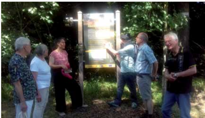
Teilnehmer:innen der Diözesanversammlung wandern am Samstagnachmittag auf dem Äbtissinnenpfad durch den lichtdurchfluteten Heiligkreuztaler Wald.

Spirituell gestärkt mit den Impulsen unseres Geistlichen Beirates Norbert Brücken stand der Samstagvormittag ganz im Zeichen des Tätigkeitsberichts des Vorstands und eines Antrages zu einer gemeinsamen Erklärung zum Ukraine-Krieg. Nach einem inhaltlichen Austausch zum Tätigkeitsbericht, der eine gro-