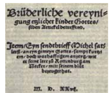
Titelseite der Schleithheimer Artikel von 1527

Seit 2015 bietet pax christi Freiburg in der Adventszeit eine Meditation zu einer Person des Friedens auf dem Lindenberg bei St. Peter an. In diesem Jahr wird vom 2. bis 3.12.2022 Michael Sattler im Mittelpunkt stehen. Sattler war zurzeit der Reformation Prior im nahen Benediktinerkloster von St. Peter. Er verließ dieses, um schließlich einer der einflussreichsten Köpfe der noch jungen Täuferbewegung zu werden.