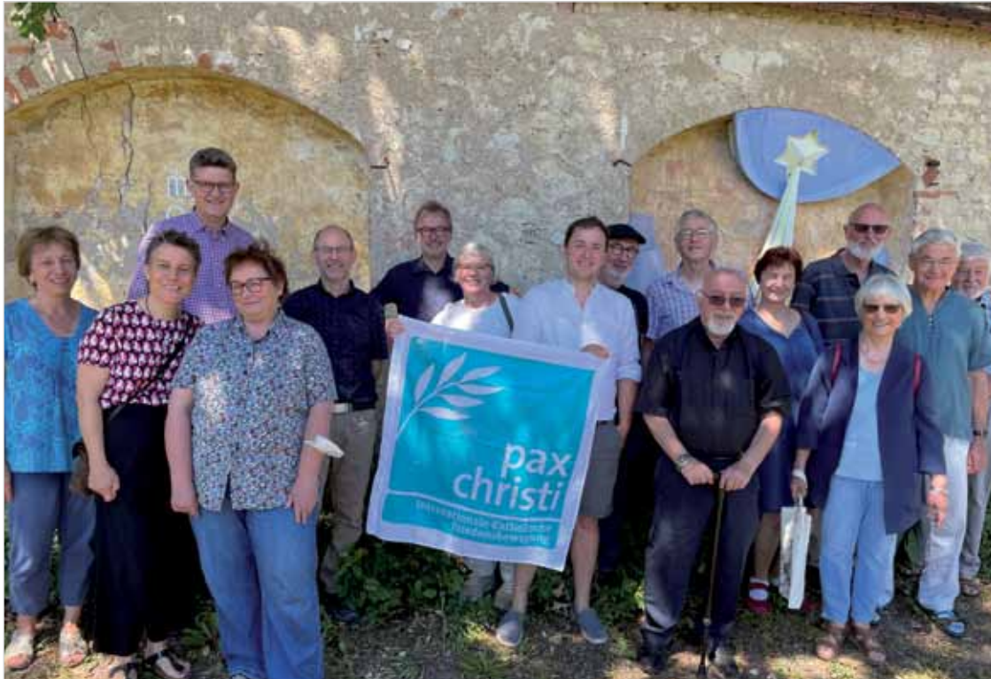
Teilnehmer:innen der Diözesanversammlung an der Klostermauer in Heiligkreuztal

Wir teilen die Sicht von Romano Prodi u.a., dass Russlands Differenzen mit der Ukraine und mit der NATO durch Verhandlungen hätten beigelegt werden sollen. Wir fordern die Einhaltung des Völkerrechts.