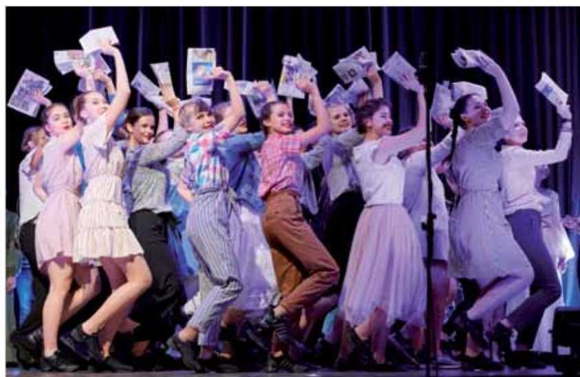
Szene aus „Musik für den Frieden“ – russische und deutsche Jugendliche performen gemeinsam einen Song.

Seit dem zwischenzeitlichen Beginn des Ukrainekrieges wurden in Deutschland törichterweise zahlreiche Beziehungen in die russische Zivilgesellschaft auf Eis gelegt oder gar ganz abgebrochen. Als Signal gegen diesen fatalen Trend wäre die öffentliche Preisverleihung an ein rein zivilgesellschaftliches deutsch-russisches Friedensprojekt umso wichtiger gewesen. Doch stattdessen hatte der Ukrainekrieg genau die gegenteilige Folge: am 18. Juni teilte der GFP-Stiftungsvorsitzende Hans-Jörg Röhl den völlig überraschten Preisträgern die Absage der für den 10. September geplanten Feier mit. Ohne Begründung. Auch eine nachfolgende Pressemitteilung sowie die gemeinsame Erklärung von Röhl und dem Kuratoriumsvorsitzenden der Stiftung, Götz Neuneck, auf der GFP-Webseite enthalten keine Begründungen. Auf Nachfragen von Journalist:innen erklärte der Pressesprecher der Stiftung, Thomas Richter: „Wir geben keinen Grund an.“ (Badische Zeitung, 23.6.2022). Auch stiftungsintern waren und sind bis heute keine triftigen oder gar zwingende Gründe für die Absage zu erfahren.