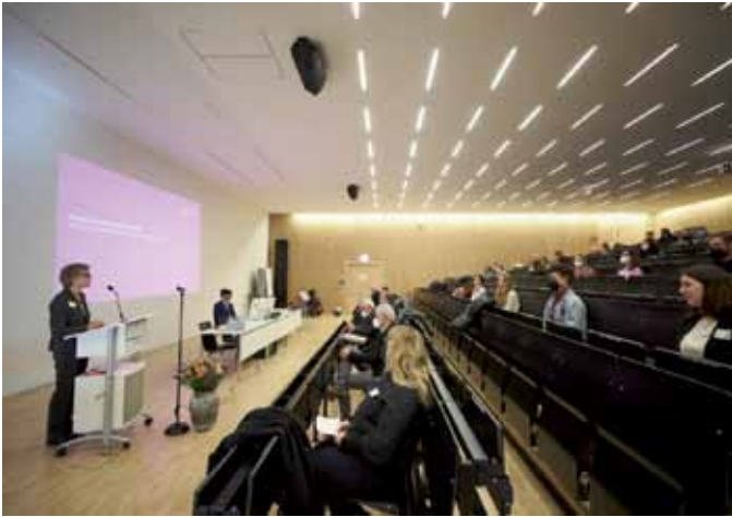
Wenige Tage nach dem Einmarsch Russlands in die Ukraine einen Studiengang „Friedenspädagogik“ zu eröffnen, bezeichnete Rektorin Renate Kirchoff als eine „herausfordernde, eine fast paradoxe Situation“

Diskurs zu haben und zu verstehen, worauf Diskussionen rund um die Friedenspädagogik fußen.