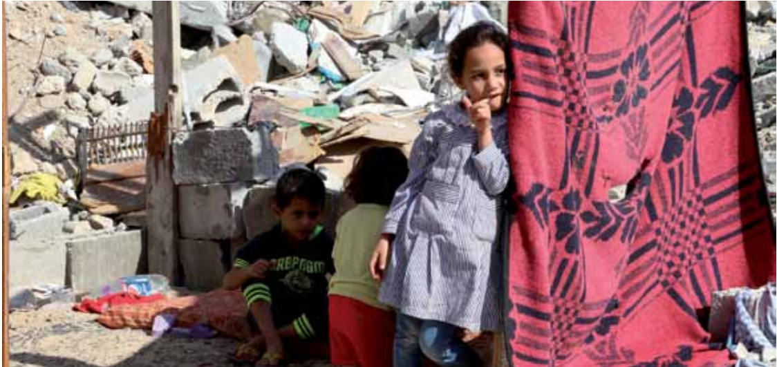
Ob Haus oder Schule, „The Israeli Comitee Against House Demolitions“ berichtet immer wieder von solchen Vorgängen, die wöchentlich benannt und ins Gebet genommen werden.

Geist alle trösten, die einen geliebten Menschen verloren haben. Wir beten für die schnelle Erholung aller Verletzten. Wir bitten auch, dass Kirchenräume den Sicherheitsvorschriften entsprechen.